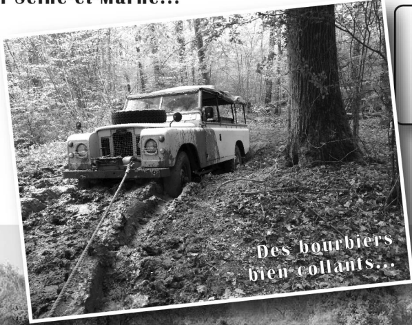
Des bourbiers bien collants...

« Je propose de remettre les roues dans les chemins et de nous retrouver le 25 Avril pour une petite balade sympathique ! »