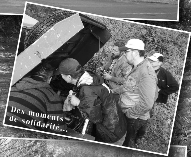
Des moments de solidarité...