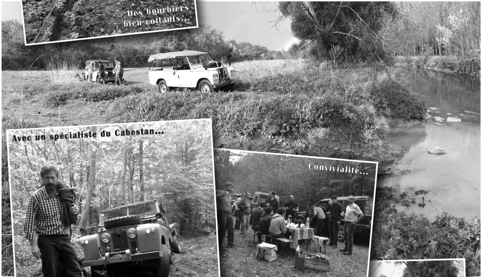
Avec un spécialiste du Cabestan...