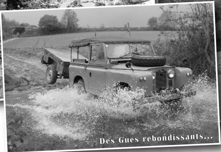
Des Gués rebondissants...